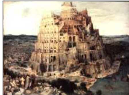
Brueghel, Pieter (il Vecchio), La Torre di Babele, 1563, Vienna, Kunsthistorisches Museum

A differenza di altre, in quest'opera Tomatis affronta in maniera sistematica la tematica dell'apprendimento delle lingue seconde, sia da bambini che da adulti, mosso dall'emergenza - intesa sia come emersione che come allarme - della nuova Europa Unita, multilingue per vocazione e natura, ma i cui cittadini faticano a considerarsi e ad essere pienamente poliglotti. Sbarazzatosi un po' troppo rapidamente delle possibilità dell'esperanto come lingua veicolare europea, con schietto pragmatismo Tomatis affronta il problema dell'insegnamento dell'inglese come lingua seconda, in particolare per i parlanti di lingua francese. L'esperienza decennale mostra che l'inglese è una lingua particolarmente ostica per i parlanti francesi, nonostante numerosi anni di apprendimento scolastico. Il motivo, secondo Tomatis, sta nell'orecchio: l'orecchio francese è sordo ai suoni della lingua inglese. In termini più tecnici,