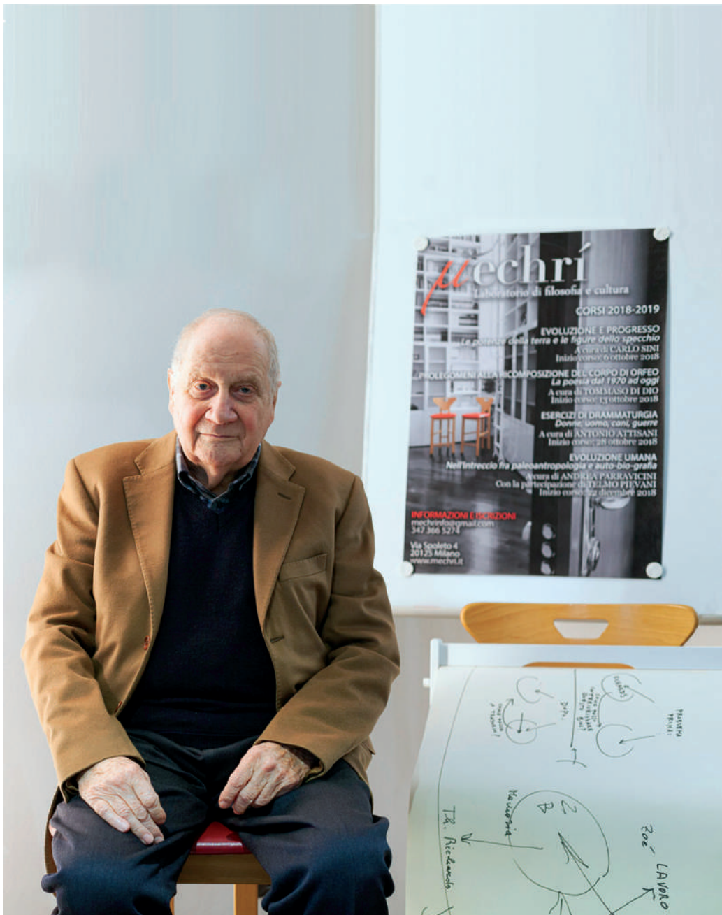
Carlo Sini (Bologna, 6 dicembre 1933 -)